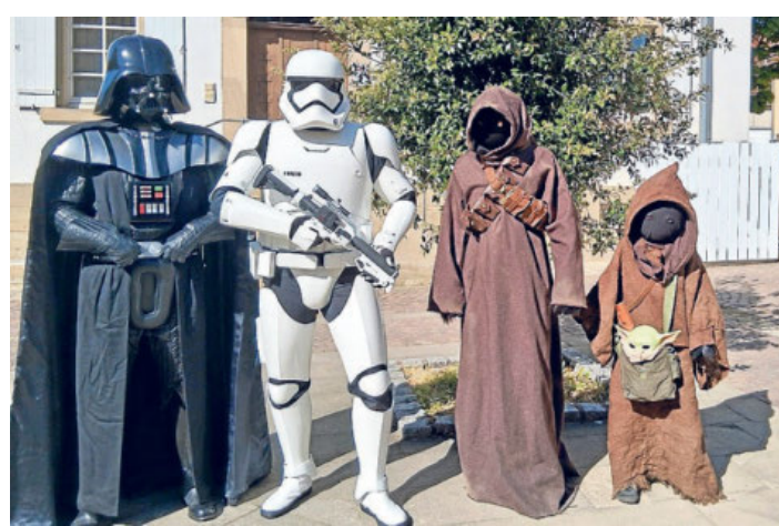
Beim „Star Wars“-Tag in der Stadt- und Kurbücherei schauten auch die Filmcharaktere höchstpersönlich vorbei.

Offiziell wird der „Star Wars“-Tag zwar erst am 4. Mai ausgerufen. Weil sich die Bücherei aber samstags traditionell über ein volles Haus freuen darf, hat Bücherei-Leiter Jonas Heinzmann die Begegnungen mit Darth Vader, Luke Skywalker und anderen Charakteren kurzerhand vorverlegt. Plötzlich spazierte die Mitglieder der Cosplay-Gruppe „50th Legion