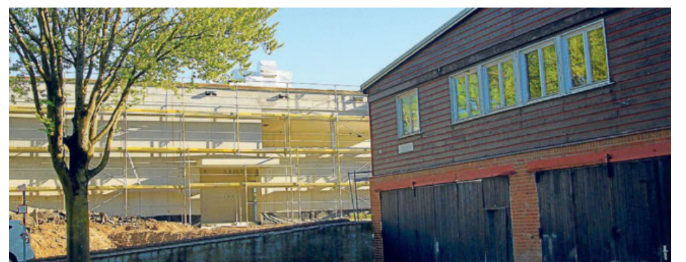
Der Feuerwehr/Bauhof-Neubau im Hintergrund kommt gut voran, doch die Kosten sind schwer zu kalkulieren. Im Vordergrund ist das bisherige Bauhofgebäude zu sehen.

Die jetzt vom Gemeinderat einstimmig bewilligten Nachtragsangebote der Firma Züblin haben jedoch nichts mit der Konjunktur oder dem Krieg zu tun, sondern schlicht mit dem Untergrund. Der ist, wie sich erst beim Bau herausgestellt hat, weniger tragfähig als angenommen, sondern in fünf Metern Tiefe „von sehr weicher Konsistenz“, was im Vorfeld nicht erkennbar gewesen sei, wie in der